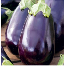
Aubergine Black Beauty