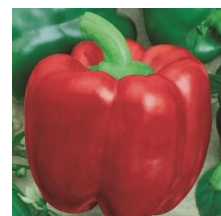
Poivron 'california wonder'