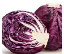
Chour Rouge 'Koda'