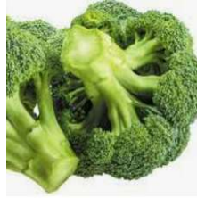
Brocoli 'Verde Calabrese'