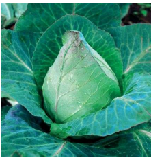
Chou 'coeur du boeuf'