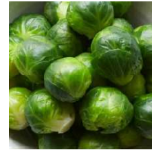
Chou Bruxelles Sanda