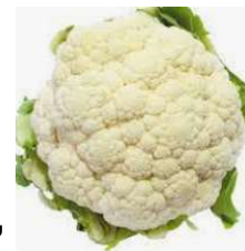
Chou fleur 'Alpha 6 Fortados'